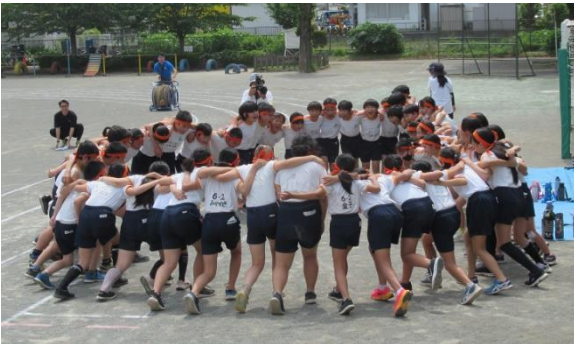
↑ 始まる前に円陣を組む6年生 ↓ 最後に2校一緒に記念写真。

6月7日（金）に、本校を会場にして中富小学校との2校親善体育大会を行いました。 今年の中富小学校の6年生は1学級です。本校より少し人数は少ないもののやる気は同じ。あたたかい声援の中、互いに力を出し切る姿が見られました。