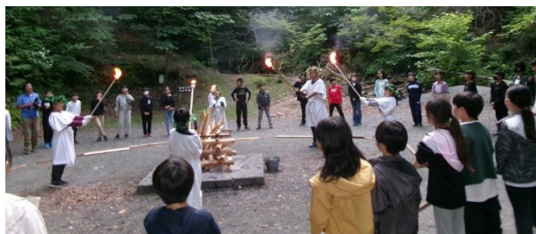
←5年生自然教室での キャンプファイヤー

1日目の午後に行ったことで、観光客が少ない中で見学できた修学旅行の日光東照宮 →